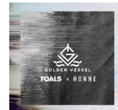
Inspiratie platenhoes Foals x Honne van Golden Vessel.

staat de hoesafbeelding te vertalen in een pixeltekening welke vervolgens werd verschaald naar de gevelafmetingen. Elke pixel vertegenwoordigt daarbij een oppervlak van 5 x 5 cm, de grootte van elk mozaïektegeltje. Nu was het zaak ook de tekening en de kleuren te laten matchen. STO beschikt over 'slechts' 40 tinten. Al weer bracht Photoshop de oplossing. Dit programma vertaalde met algoritmen elke pixel in de meest dichtbij liggende tint uit het STO-assortiment.