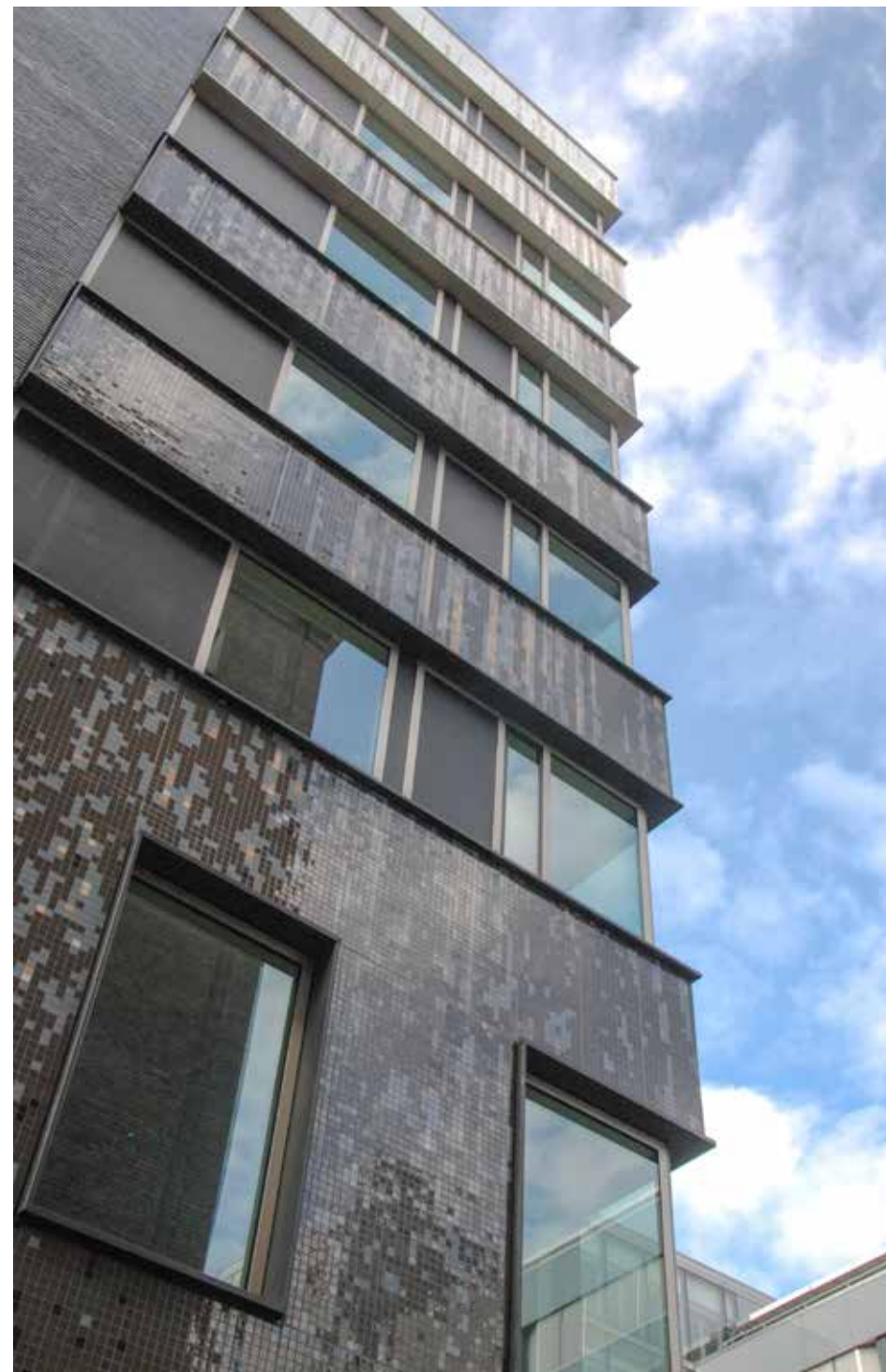
Mooi verloop van de gevel